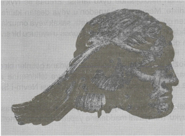
Hesim 1- Rüyalar tanrısı Morpheus'un babası Hypnos'un Roma devrinden kalma bronz heykeli.

Hypnos'e kelimesini ilk defa İngiliz doktor BRAID kullanmıştır. Kendisine bu konuda Yunan Mitolojisi kaynaklık etmiştir. Yunan mitolojisinde HYPNOS şu şekilde geçmektedir. «Yunan Mitolojisinin Uyku Tanrısı «HYPNOS» Gece'nin oğlu ve Ölüm'ün (Thanatos) kardeşidir. (Resim: 1) Kardeşi ile birlikte Hades'in Ölüler diyarında yaşar. Kanatlı bir genç şeklinde tasvir edilen Hypnos, yorgun insanların alımlarına sihirli değneği iledeğmek, karanlık kanatları ile yelpazelemek ya da bir boynuzdan, kişilerin üzerine uyku verici bir madde dökmek suretiyle onlara uyku verir. Thanatos'da kanatlı bir ruh halinde tasvir edildiğinden aynen Hypnosa benzer. Hypnos'un oğullarından biri ise, Rüyalar Tanrısı «MORPHEUS»dur.