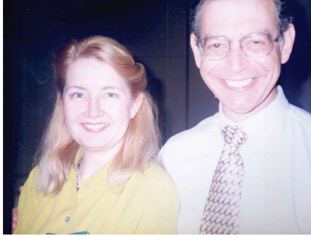
Aynı kongreden İsraili bir hipnoterapist ile birlikte..